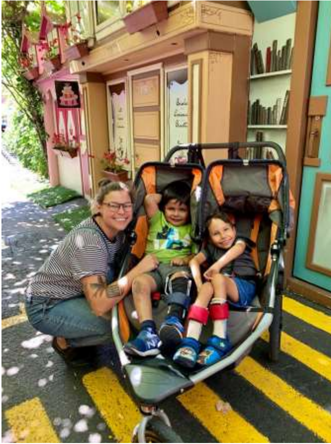
Sortie au bar laitier. Miam !!