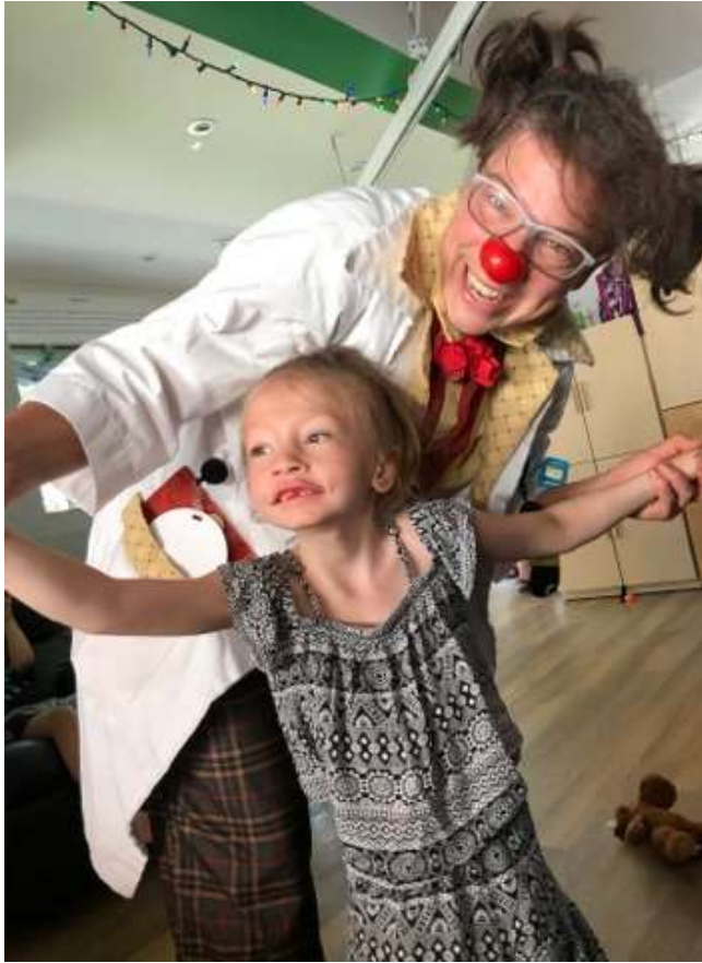
Alycia et Toupet de la fondation Dr Clown